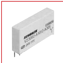
SLIM PCB RELAY SNR